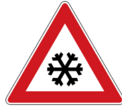
Be careful in winter 注意降雪