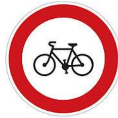
No cycling 禁止自行車