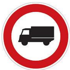
No lorries 禁止大貨車