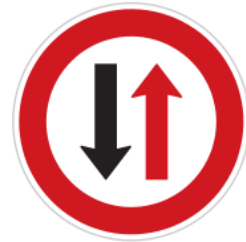
Oncoming vehicles have priority 來車優先