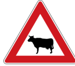
Animals (domesticated) 注意動物(經馴養)