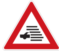
Caution, fog likely 注意起霧