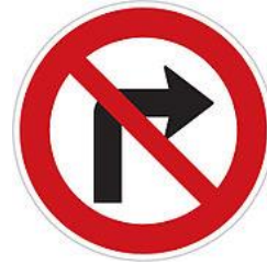
No right turn 禁止右轉