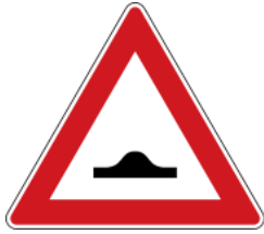
Caution, speed bump 注意減速路障