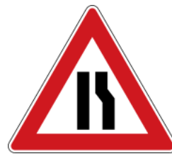
Road narrows (right side) 道路狹窄(右邊車道)