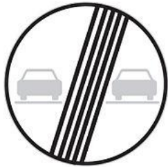
End of no-overtaking zone 禁止超車路段終止