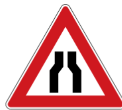
Road narrows (both sides) 道路狹窄(雙向)