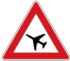
Aircraft (landing corridor above road) 注意飛機(車道上空為降落航道)