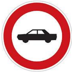
No cars 禁止汽車