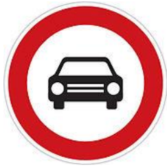
No entry for vehicles, except motorcycles 禁止汽車進入(摩托車除外)