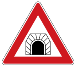
Caution, tunnel 注意隧道