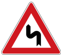
Double curve, first to the left 先向左轉之連續彎路