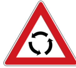
Caution, roundabout warning 注意圓環