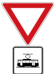
Give priority to trams 電車優先