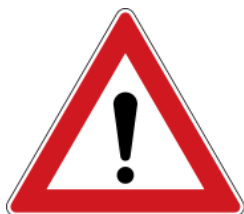
Other hazard 注意危險