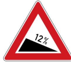
Dangerous descent 12% (5.4°) (100% = 45°) 道路向下傾斜 12%