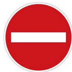
No entry for vehicles 禁止進入