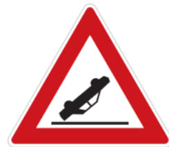
Caution, accident black spot 注意易肇事路段