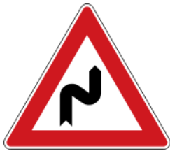
Double curve, first to the right 先向右轉之連續彎路