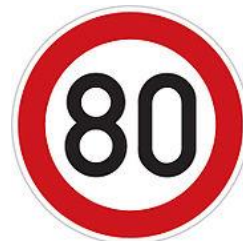
Speed limit 80km/h 最高速限