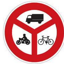
No entry to the vehicles indicated 禁止標示車輛