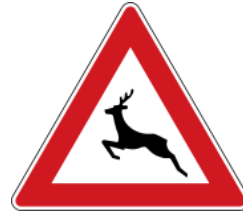
Wild animals 注意野生動物