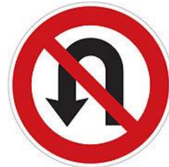
No turning in the road 禁止迴轉