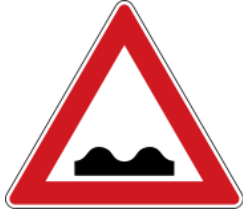
Bumpy road 路面顛頗