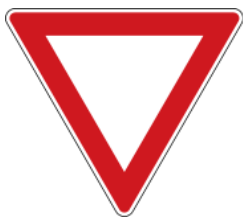
Give way 禮讓