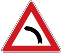
Curve to the left 左轉