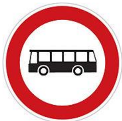
No buses 禁止公車