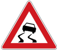
Danger of skidding 路滑