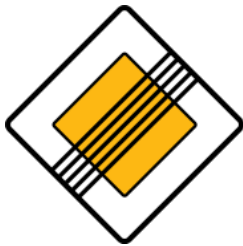
Caution, end of priority road 主要幹道終止