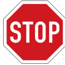
Stop and give way 停止