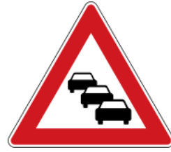
Caution, queues likely 注意塞車