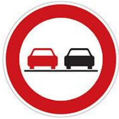
No overtaking 禁止超車