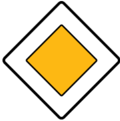
Main road 主要幹道