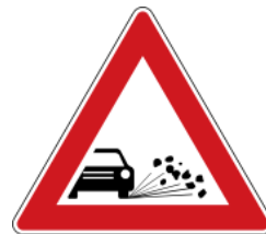
Loose gravel 注意碎石