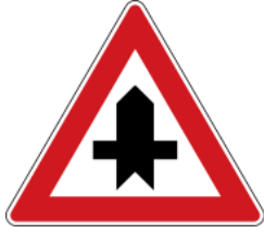
Junction with minor roads 注意前與非主要幹道交會