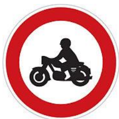
No motorcycles 禁止摩托車