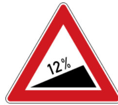
Dangerous climb 12% (5.4°)(100% = 45°) 道路向上傾斜 12%