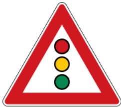
Traffic lights ahead 前方有紅綠燈