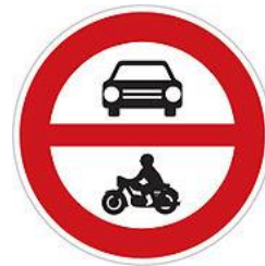
No motor vehicles 禁止汽機車