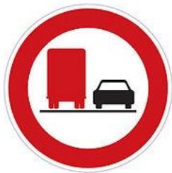
No overtaking by lorries 禁止大貨車超車