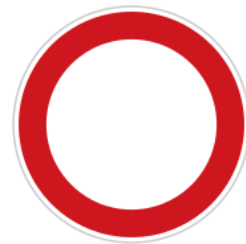
No entry for vehicles (both directions) 禁止進入(雙向)