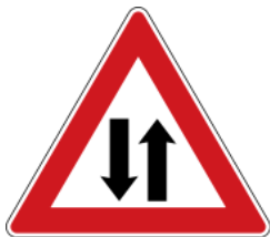
Two-way traffic 雙向道路