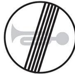
End of no audible warnings zone 禁鳴喇叭路段終止