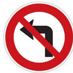
No left turn 禁止左轉