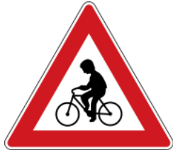
Caution for bicyclists 注意自行車