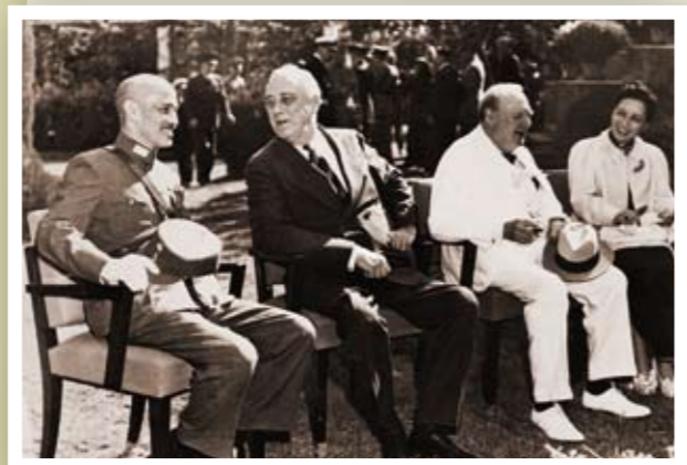
中華民國國民政府主席蔣中正、美國總統羅斯福、英國首相邱吉爾等三國領袖於民國32（1943）年11月間舉行「開羅會議」。堅持日本無條件投降，並應將東北四省、台灣和澎湖群島歸還中華民國。