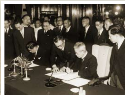
《中日和約》明定日本放棄對臺灣、澎湖列島以及南沙群島及西沙群島的一切權利、權利名義與要求；中日之間在民國30（1941）年12月9日以前所締結之一切條約、專約及協定（包括《馬關條約》），均因戰爭結果而歸無效。