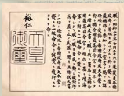
左圖為日本政府照會中、美、英、蘇四國政府，正式接受波茨坦宣言之各項條件。

《開羅宣言》是中華民國戰後光復臺灣之重要法律依據。民國34（1945）年10月25日起中華民國政府開始在臺灣行使主權行為，宣告臺灣恢復為我國領土。