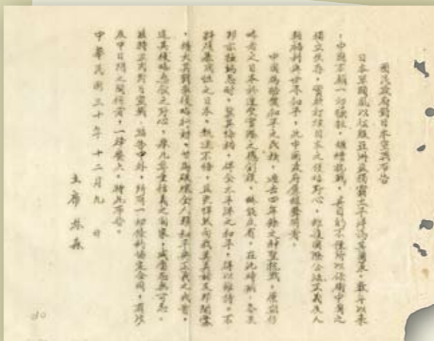
民國30（1941）年，我國發布《對日本宣戰布告》稱，「所有一切條約、協定、合同，有涉及中、日間之關係者，一律廢止。」

《開羅宣言》確定戰後臺灣及其附屬島嶼（包括釣魚臺列嶼）應歸還中華民國，並使我國洗雪1895年《馬關條約》割讓臺灣及其附屬島嶼的國恥，亦為歷經八年浴血抗戰犧牲二千五百萬軍民贏得勝利後所獲得之最重要成果。有關臺灣、澎湖及其附屬島嶼在二次世界大戰之後地位歸屬，亦經由《開羅宣言》、《波茨坦公告》、《日本降伏文書》及《舊金山和約》以及1952年《中日和約》一系列法律文件獲得法律上之解決，可以說沒有《開羅宣言》，中華民國就沒有過去六十年多來在臺澎金馬地區繼續生存，進而繁榮壯大之機會。