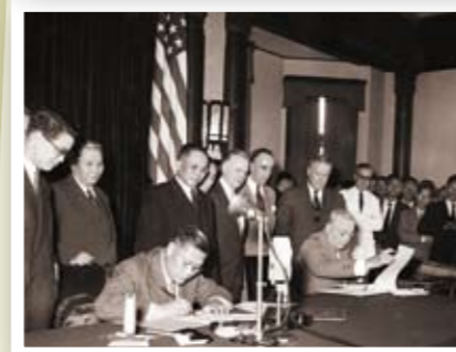
民國34（1945）年中英美蘇共同發佈之《波茨坦公告》，明定《開羅宣言》之條件必須實施。