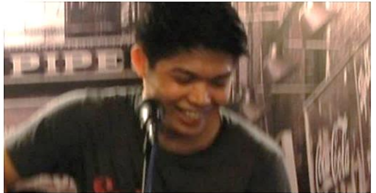
Ninjabears And Tiny Tina - Falling in love with Taiwan

Hello everyone! During the last day of the Taiwan Study Camp, our group performed my composition as tribute to the awesome experience in Taiwan. The song is less than 2 minutes so if you have time, please listen and share if you think this can save the world. If you do, May you be blessed with golden sparkles, random shiny shimmering splendid stuff and probably 3 air high-fives. This is Ninjabears featuring Tiny Tina, recorded in two different countries, halfway between the gutter and the stars.