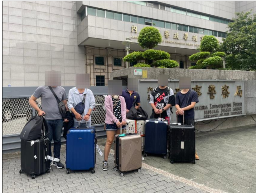
刑事警察局救援 6 名民眾