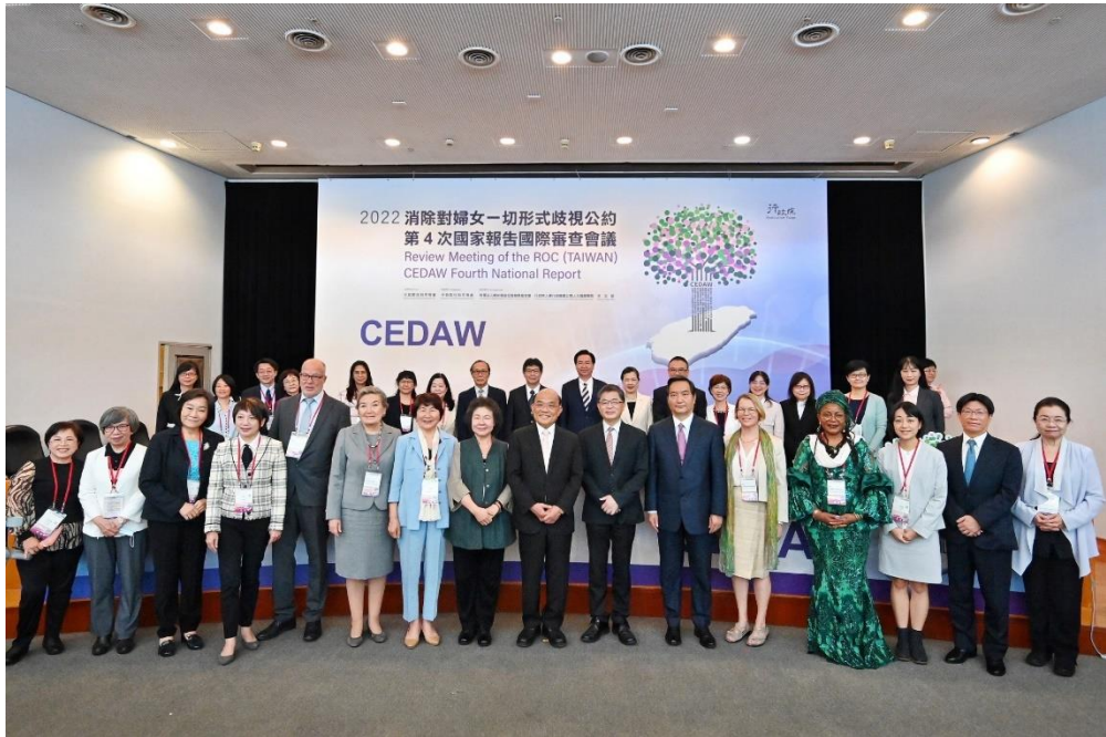
CEDAW 第4次國家報告國際審查會議 11月28日開幕儀式。