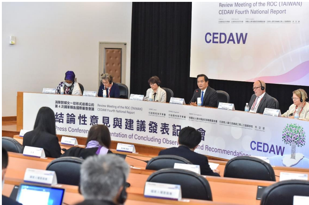
CEDAW 第4次國家報告國際專家審查順利完成 5位國際婦女人權專家提出 86點結論性意見與建議。