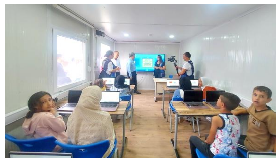
圖 16：我國援贈災區 Hatay 省之組合屋資訊教室上課情形。