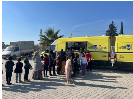
圖 2：Hatay 省災民於我國援贈之行動湯車外排隊領取熱食。