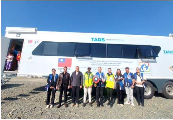
圖 17：我國援贈災區 Hatay 省組合屋城市之行動學習中心外景。