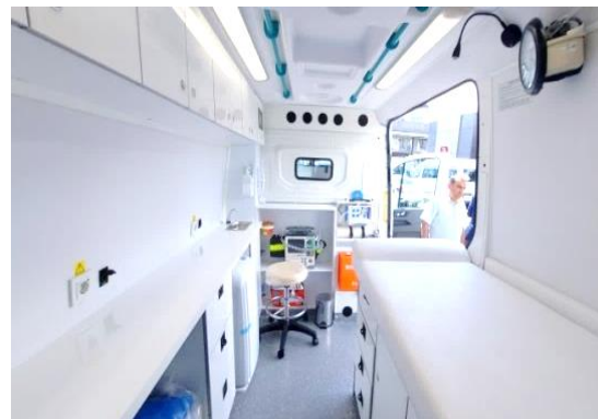
圖 14：我國援贈災區之行動診所內景。

(四) 社會發展與援助動員協會(SGDD-ASAM) —「災區教育復原計畫」：本案援助金額 700 萬美元(實際以新台幣 215,390,000 元結兌)，駐土耳其代表處與該協會於 112 年 6 月 19 日簽署本案合作協議，各項子計畫執行情形如下：