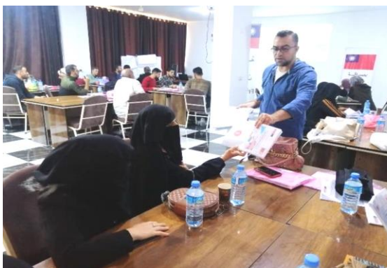
圖 36：為協助災民重拾生計，規劃辦理商業訓練，並提供經營諮商服務。