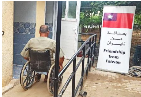
圖 35：我國援助美慈組織於北敘利亞震災區重建包括醫院及學校等基礎設施。