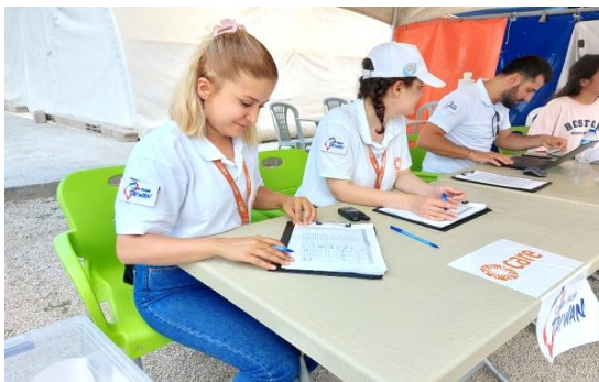
圖 21：Care Türkiye 團隊於 Hatay 省 Sinop 帳篷區發送我國援助之物資。