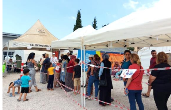
圖 20：Hatay 省 Sinop 帳篷區災民排隊領取我國援助之物資。