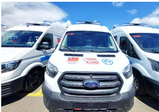
圖 13：我國援贈災區之行動診所外觀。