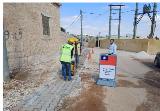
圖 37：為穩定供應災區乾淨用水，我國援助美慈組資重建當地供水系統。