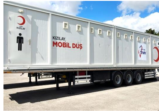
圖 28：我國援贈災區之行動淋浴車外觀。

(七) 土耳其全國身障聯合總會 (Türkiye Sakatlar Konfederasyonu)——「攜手共度百年強震難關計畫」：本案援助金額 500 萬美元(實際以新台幣 153,850,000 元結兌)，駐土耳其代表處與該總會於 112 年 9 月 18 日簽署合作協議，各項子計畫執行情形如下：