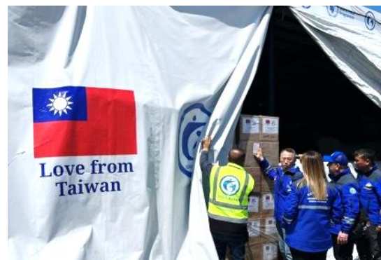
圖 5：我援助物資於 Hatay 省臨時倉庫存放情形。