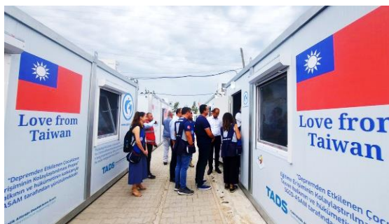
圖 15：我國援贈災區 Hatay 省之組合屋資訊教室外景。