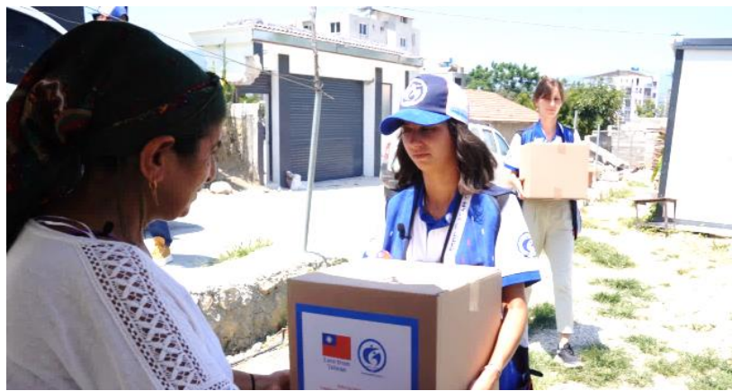
圖 10：ASAM 向災民發送我國援贈之物資。

(三) 社會發展與援助動員協會(SGDD-ASAM) —「災區醫療服務計畫」：本案援助金額 200 萬美元(實際以新台幣 61,540,000 元結兌)，駐土耳其代表處與該協會於 112 年 4 月 13 日簽署合作協議，各項子計畫執行情形如下：