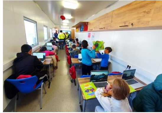
圖 18：我國援贈災區之行動學習中心內上課情形。

(五) 國際關懷組織土耳其分會(Care Türkiye)——「緊急物資援助計畫」 ：本案援助金額 400 萬美元(實際以新台幣 122,520,000 元結兌)，駐土耳其代表處與該會於 112 年 3 月 30 日簽署合作協議，本案並已於 112 年 11 月辦理完成，各項子計畫執行成果如下：