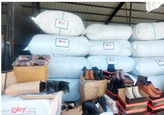
圖 6：我國援助 Hatay 省災民緊急物資。