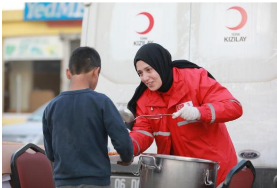
圖 23：我國援贈災區之熱食發送情形。