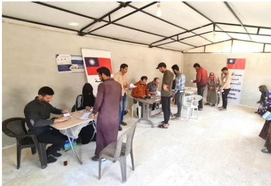
圖 34：符合受援資格的敘利亞災民領取我國提供的援助金。