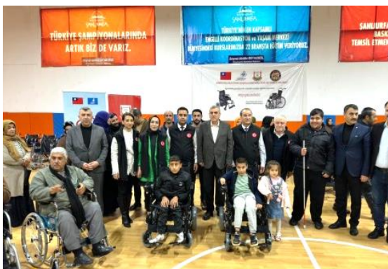
圖 29：Şanlıurfa 市政府及土耳其全國身障聯合總會於 Şanlıurfa 市辦理本案輔具捐贈儀式，市長 Zeynel Abidin Beyazgül(中立者)出席。