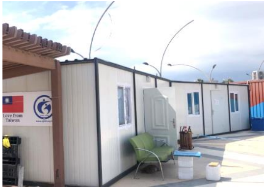
圖 11：我國援贈並設於 Hatay 省之組合屋診所外觀。