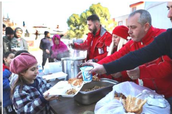
圖 24：我國援贈災區之熱食發送情形。