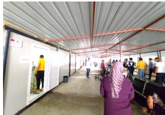
圖 12：民眾於原 Hatay 省立醫院旁我國援助設置之組合屋醫療診所外等候看診。