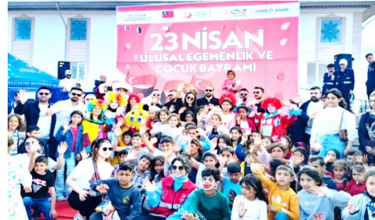
圖 9：我國援助 ASAM 與 Gaziantep 市府及「土耳其全國身障聯合總會」合作，於震災區 Gaziantep 省 Nurdağı 鎮辦理兒童節活動。