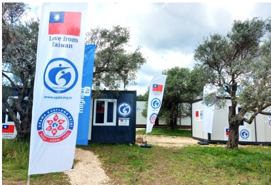
圖 4：ASAM 運用我國援款於 Hatay 省 Antakya 市設立之「台灣援助計畫協調中心」。