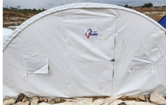
圖 22：位於 Hatay 省 Kırıkhan 市印有 Love from Taiwan 標語之帳篷。