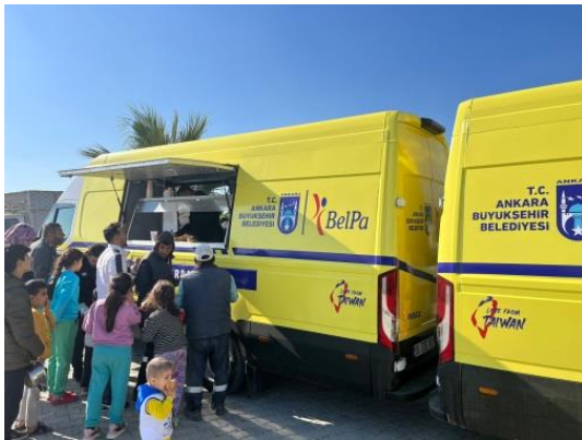
圖 1：我國援贈之行動湯車外清楚標示我國意象圖案。