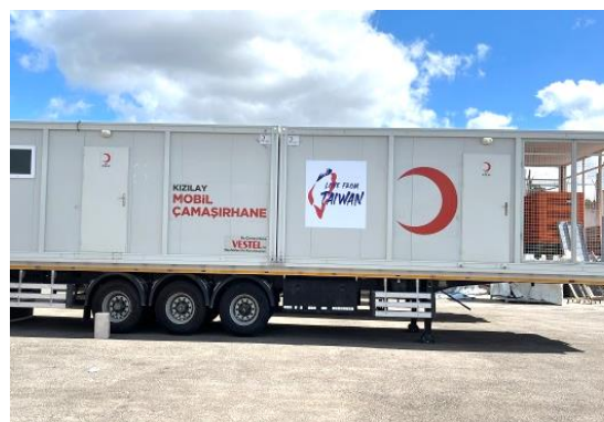
圖 26：我國援贈災區之行動洗衣車外觀。