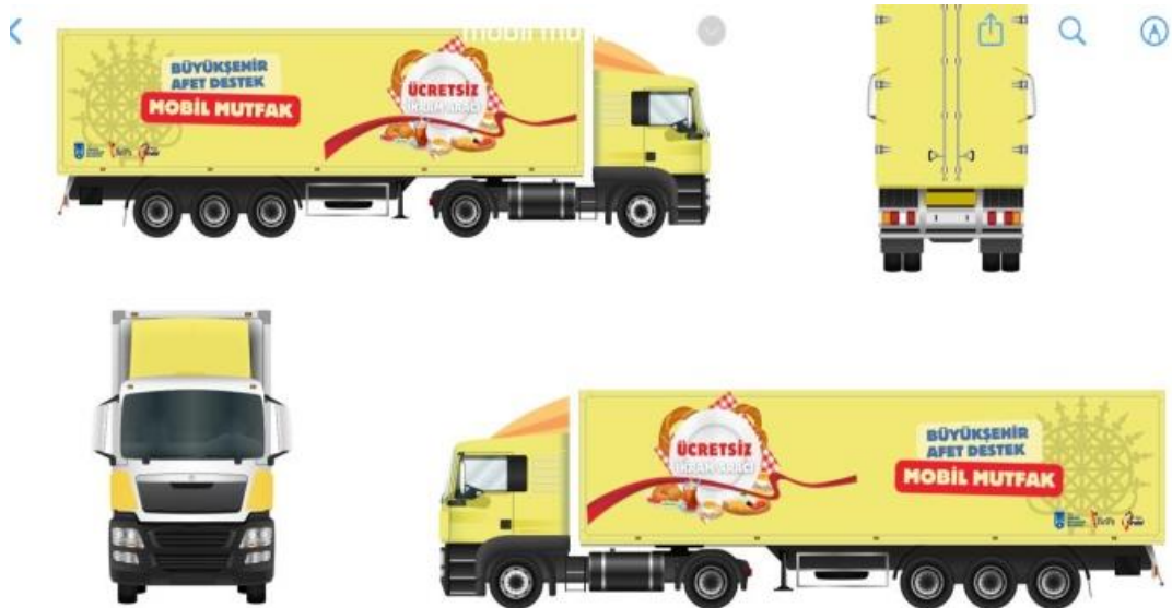
圖 3：行動廚房餐車外觀，車身設計標示我國援贈圖像。

(二) 社會發展與援助動員協會 (Association for Social Development and Aid Mobilization, SGDD-ASAM)—「震災緊急人道援助計畫」：本案援助金額 400 萬美元(實際以新台幣 122,520,000 元結兌)，駐土耳其代表處與該協會於 112 年 3 月 28 日簽署合作協議，各項子計畫執行情形如下：